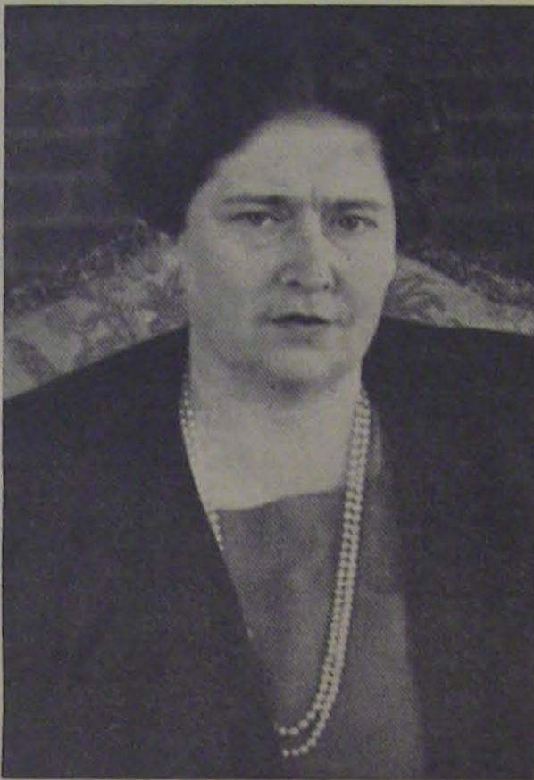
Nj. V. KRALJICA MARIJA

Nj. V. KRALJ PETAR II I Nj. V. KRALJICA Marija POČASTVOVALI SU SVOJIM LIČNIM UČEŠĆEM VEOMA USPELE SVEČANOSTI U KEMBRIDŽU.