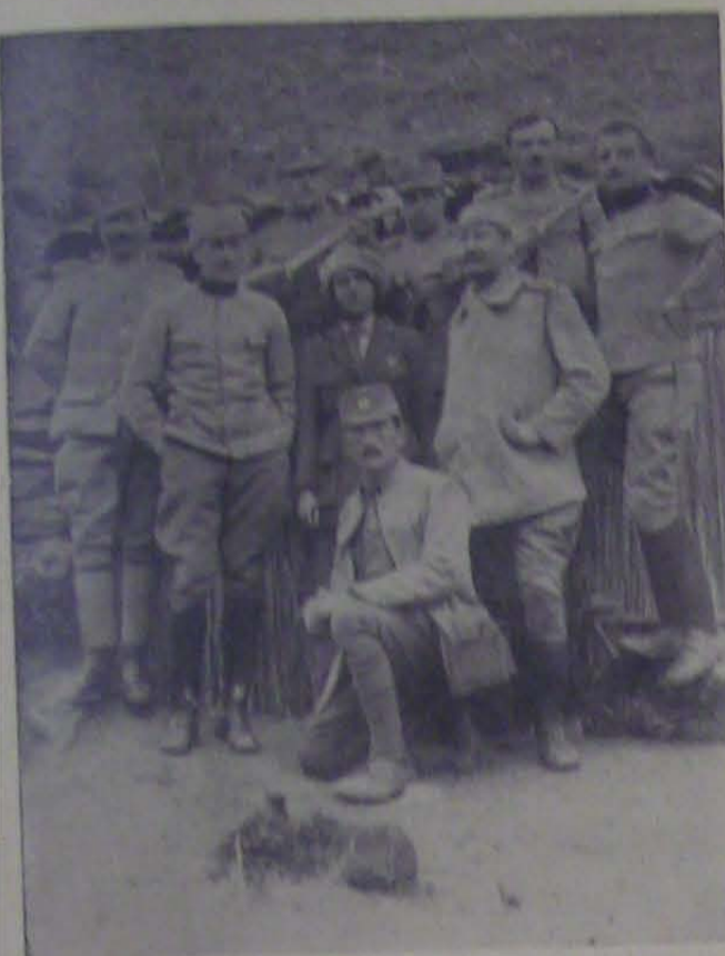
Potporučnik Draža Mihailović (kneži u prednjem redu) snimljen 1917. pred zemunskom na solunskom frontu kod Dobrog Polja.