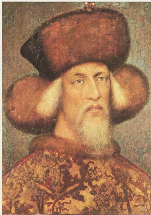
Portret Sigismunda Luksemburškega, pripisan Pisanellu, verjetno iz leta njegovega kronanja za rimskega cesarja 1433