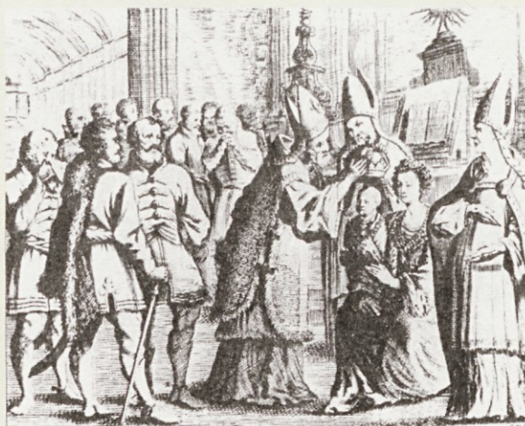
Kronanje Ladislava Posmrtnega 1440 v delu Jakoba Fuggerja Spiegel der Ehren des höchstlöblichsten Kaiser und Königlichen Erzhauses Österreich iz 1668