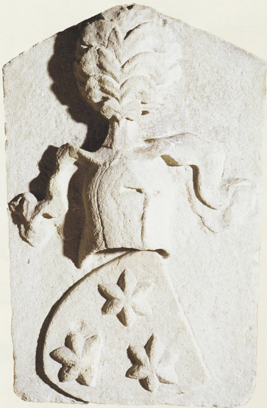
Plošča z (nepravim) grbom Celjskih grofov iz Knežjega dvora v Celju