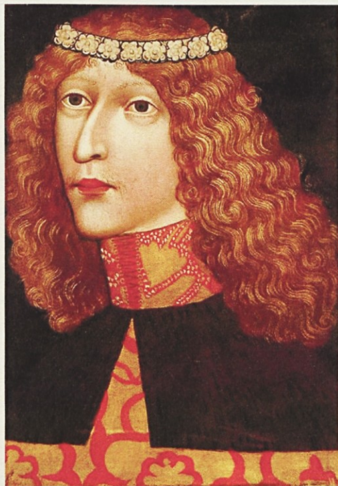
Portret Ladislava Posmrtnega iz leta njegove smrti 1457

S igismundu Luksemburškemu in Barbari Celjski se je rodil samo en otrok, hči Elizabeta (okrog 1409), katero je Sigismund že 1411 zaročil z avstrijskim vojvodo Albrehtom V.; mladeničem, ki je pravkar nastopil samostojno vlado. Habsburško hišo so v začetku 15. stoletja pretresale notranje razprtije, katerih korenine so segale v leto 1379, ko se je dinastija razdelila na leopoldinsko in albertinsko linijo. Prva je vladala na Štajerskem, Koroškem, Kranjskem, Tirolskem in v Prednjih deželah ob zgornjem Renu, druga pa v obeh Avstrijah nad in pod Anišo, ki sta bili daleč najbogatejši habsburški deželi. Geografsko sta se ti dve deželi ob Donavi navezovali na kompleks luksemburške moči na Češkem in Moravskem in politika albertinske linije je bila usmerjena v sodelovanje z luksemburškim sosedom. V tej smeri je deloval že Albreht IV., oče Albrehta V., ki je 1404 nepričakovano umrl. Za skrbništvo nad 1397 rojenim Albrehtom V., edinim moškim članom albertinske linije in legitimnim vladarjem v Avstriji, se je med brati leopoldinske linije vnel ogorčen boj, v katerega so se prvič kot samostojen političen dejavnik vmešali avstrijski stanovi in dosegli, da je mladi vojvoda 1411 lahko nastopil samostojno vlado. Poseg stanov v habsburške znotrajdinastične zadeve je bil precedenčen in generacijo kasneje so odigrali stanovi podobno vlogo tudi v sporu glede skrbništva nad Ladislavom Posmrtnim.