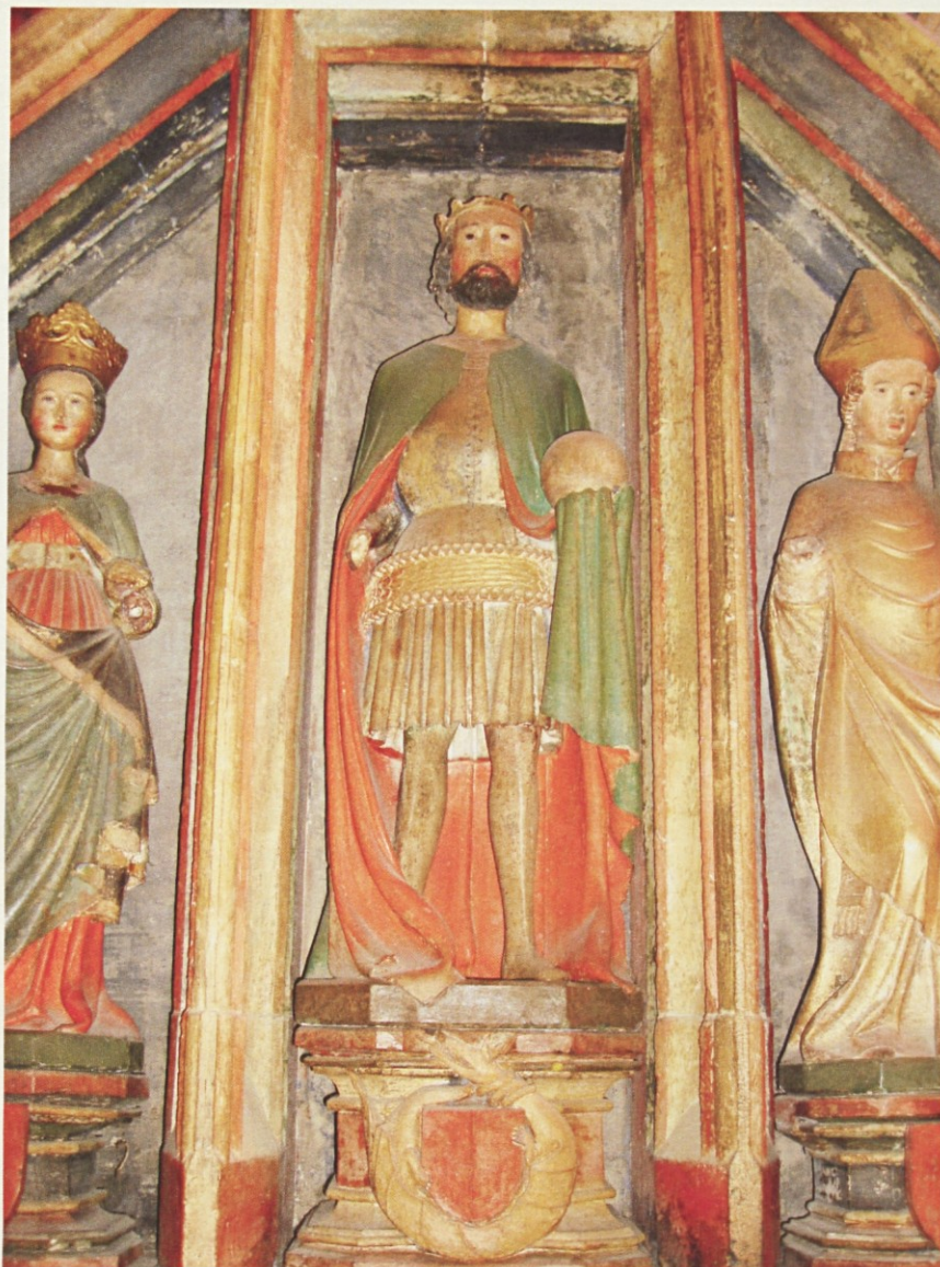
Simbol Zmajevega reda na oltarju sv. kralja Sigismunda Burgundskega († 524) v cerkvi Matere Božje na Ptujski gori