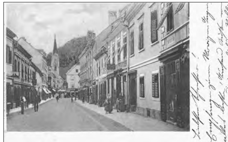
Razglednica Celja okoli 1900 (UKM, Zbirka drobnih tiskov, razgl. 9410/1)