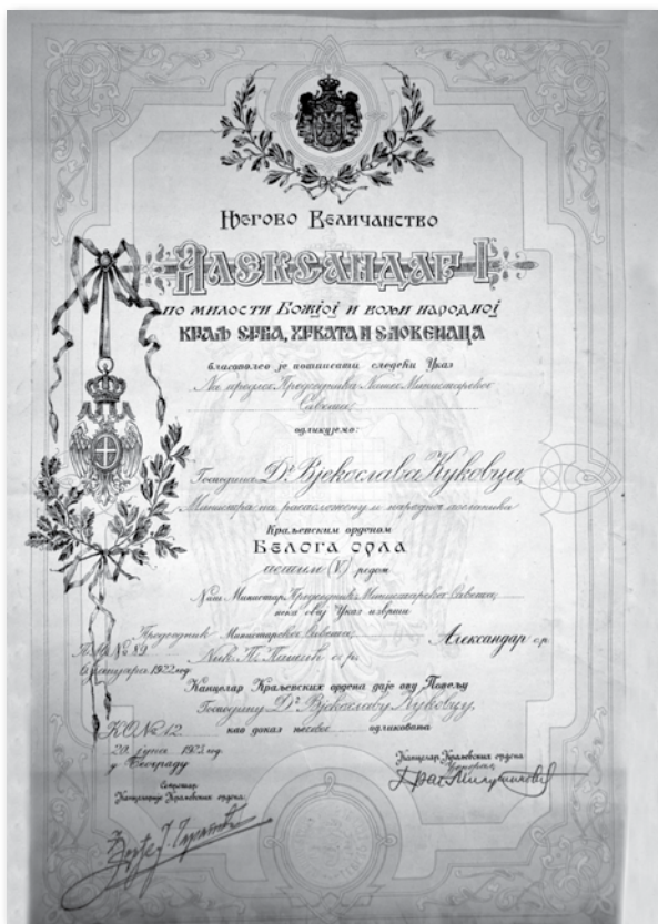
Red Belega orla (PAM, fond Vekoslav Kukovec, Sg=1585)

o ureditvi naših financ. Na seji je tekla debata tudi o višini plač poverjenikov vlade. 911