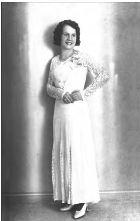
»Cici«. Kukovčeva hči. [Fotografija iz leta 1922.] Celje, šte. 5880.

1905 prevzel njegov prijatelj Vekoslav Spindler. 151 Domovina ni bila več brezbarvna, ampak se je začela jasno nagibati na liberalno stran. Tandem Spindler-Kukovec se je počasi otresel »nadzora« starih liberalcev in začel zagovarjati načelno politiko v skladu z ideali narodno radikalnega dijaštva. V ospredju so