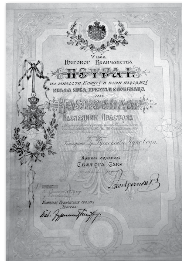
Red Svetega Save (PAM, fond Vekoslav Kukovec, Sg=1585)

na tretji seji Narodne vlade. 909 Tudi na naslednjih sejah je bilo vprašanje o denarnih zadevah v ospredju Kukovčevega političnega dela. 910 Na 24. seji Narodne vlade SHS 26. novembra 1918 je Kukovec poročal o svojih pogovorih s finančniki v Zagrebu