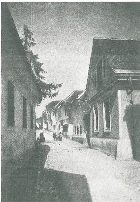
Krakovska ulica s Krakovskega nasipa

Kot za ribištvo so se poslabšali pogoji tudi za drugo v Krakovem pomembno, na Ljubljani navezano gospodarsko panogo, za čol-