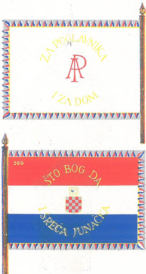
Prilog Narodnih novina od 21. svibnja 1943. broj 115 k § 2. zakonske odredbe o zastavi oružanih snaga Nezavisne Države Hrvatske.