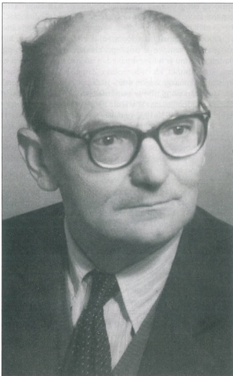
Marjan Kozina (1907-1966)

(Zgodovinski arhiv Ljubljana, Enota za Dolenjsko in Belo krajino Novo mesto, NME 192, a. e. 370; v nadaljevanju: ZAL, NME 192, a. e. ...)