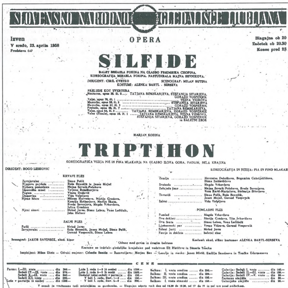
Plakat za baletno predstavo Triptihon , 1958 (ZAL, NME 192, a.e. 365)

rabila tri stavke Kozinove Simfonije: Ilovo goro, Padlim in Belo krajino. Žalni spev je nadaljevanje Ilove gore in je posvečen padlim prijateljem in tisočerm žrtvam brezumne morije.