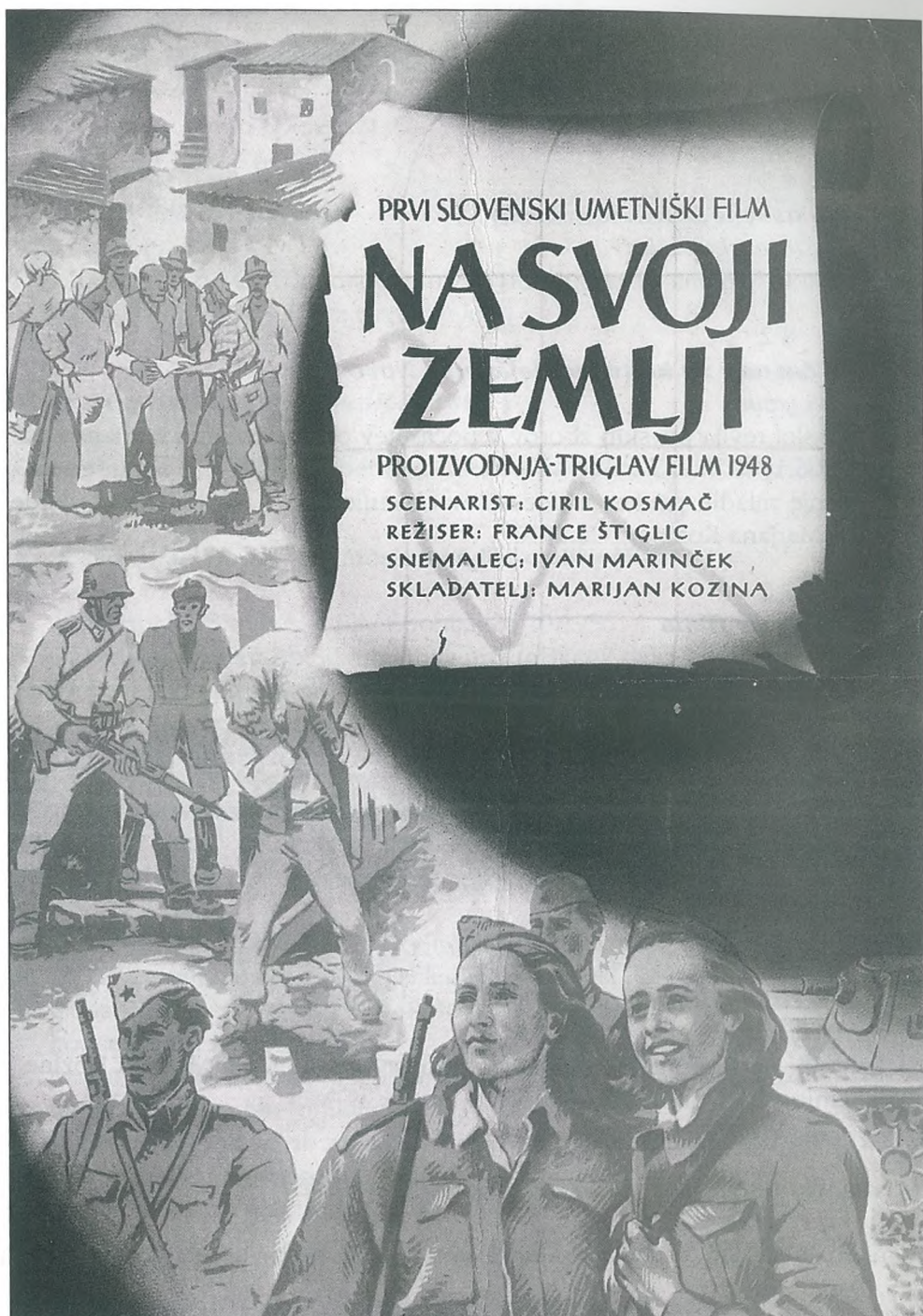
Plakat za prvi slovenski umetniški film Na svoji zemlji (ZAL, NME 192, a. e. 324)