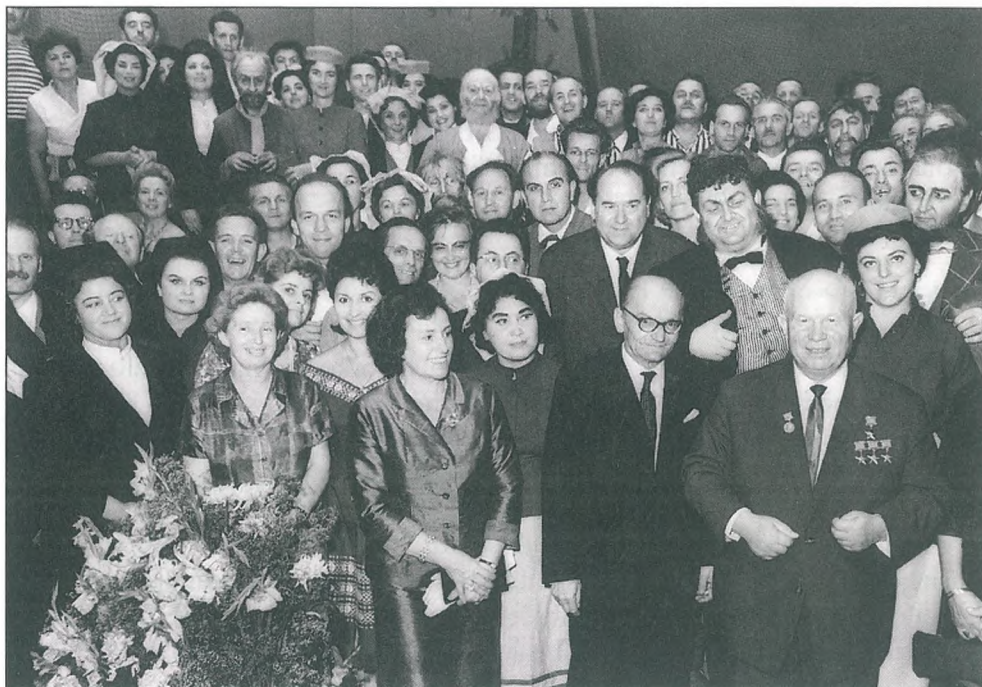
Z gostovanja opere Ekvinokcij v Moskvi, 1964