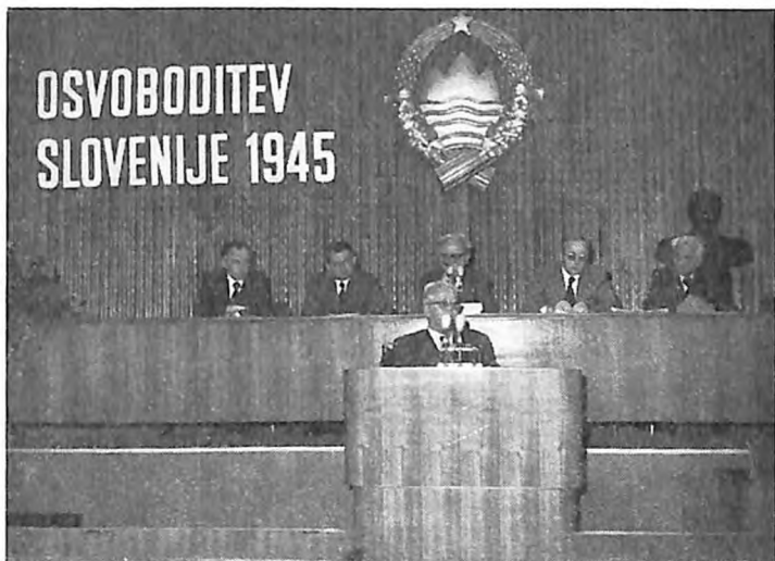
Znanstveno posvetovanje 22. in 23. 12. 1975

kulturnimi ustanovami, društvi in družbenopolitičnimi organizacijami. To se izraža s predavanji na seminarjih za učitelje zgodovine, s pomočjo zgodovinskim krožkom na šolah, pisanjem učbenikov in drugih pripomočkov za pouk novejše zgodovine v šolah, pisanjem poljudnoznanstvenih člankov za revije in časopise, še posebej s področja razvijanja revolucionarnega delavskega gibanja in revolucionarnih tradicij, pisanjem prispevkov za enciklopedije, leksikone, kronološke preglede dogodkov, sodelovanjem v vodstvu Zgodovinskega društva za Slovenijo in njegovih sekcij, sodelovanjem pri izvajanju večjih znanstvenih in tudi družbenopolitičnih akcij, npr. pisanja Zgodovine ZKJ, izdajanja Zbranih del Josipa Broza-Tita, pisanju Narodnoosvobodilne vojne na Slovenskem 1941 do