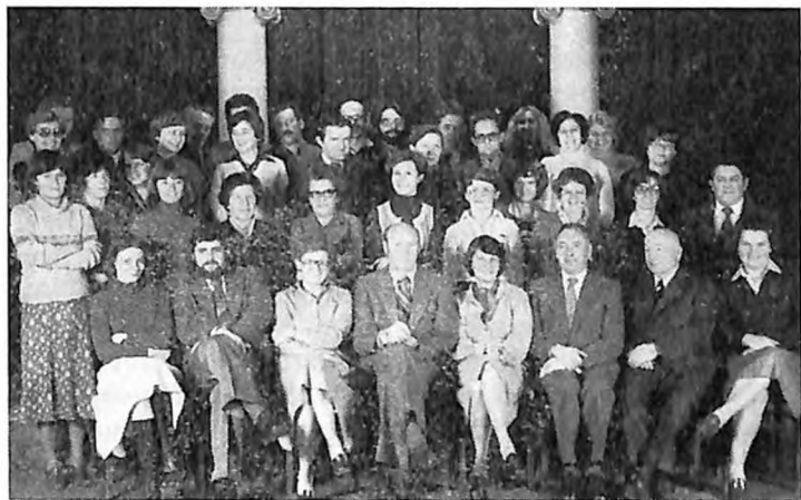
Delavci inštituta 6. 11. 1979

Čeprav so tako pobudniki in ustanovitelj kakor tudi delavci v inštitutu želeli, da bi inštitut res postal znanstvena ustanova, pa so raznolikost pogledov na raziskovalno delo (predvsem podcenjevanje strokovne usposobljenosti pri pridobivanju kadra), raznolikost zamisli o temeljnih nalogah inštituta (ali zbiranje in obdelava gradiva ali čisto raziskovalno delo, kaj naj bo osnovni predmet raziskovanja itd.), vplivi posameznikov in političnih organizacij, ki so za ravnatelja inštituta skoraj dvanajst let določale družbenopolitičnega delavca, ki je skušal po svojih najboljših močeh z več ali manj srečno roko voditi inštitut, neurejeni odnosi med organizacijskimi enotami (predvsem neurejen položaj muzeja v inštitutu) itd. ovirali