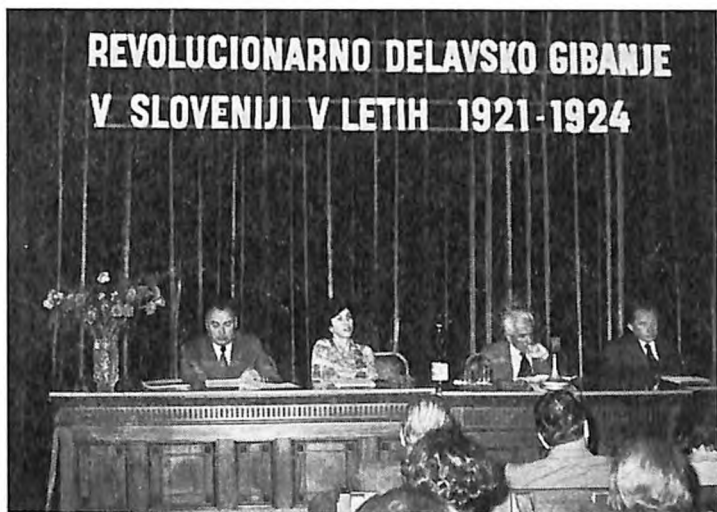
Znanstveno posvetovanje 6. in 7. 6. 1974

njih deset let, ki ima 800 naslovov, kaže enako raznovrstnost del, kar je posledica inštitutove odprtosti in njegovega odzivanja različnim družbenim potrebam, je pa obenem že več monografskih del. Ta izpričujejo težnjo inštituta po opravljanju temeljnega raziskovalnega dela in večjo strokovno usposobljenost raziskovalnega kadra. Del teh monografij so tudi uspešno obranjene magistrske naloge in doktorske disertacije. Morda vse monografije ne obravnavajo ravno najpomembnejših zgodovinskih tem in niti niso rezultat za poslednja leta toliko poudarjenega skupinskega ali celo večpanožnega dela, so pa vse zelo upoštevane in nekaj tudi nagrajenih (2 nagradi Sklada Borisa Kidriča, 4 nagrade Vstaje slovenskega naroda, 3 nagrade Osvobodilne fronte, 6 Kajuhovih nagrad, 1 nagra-