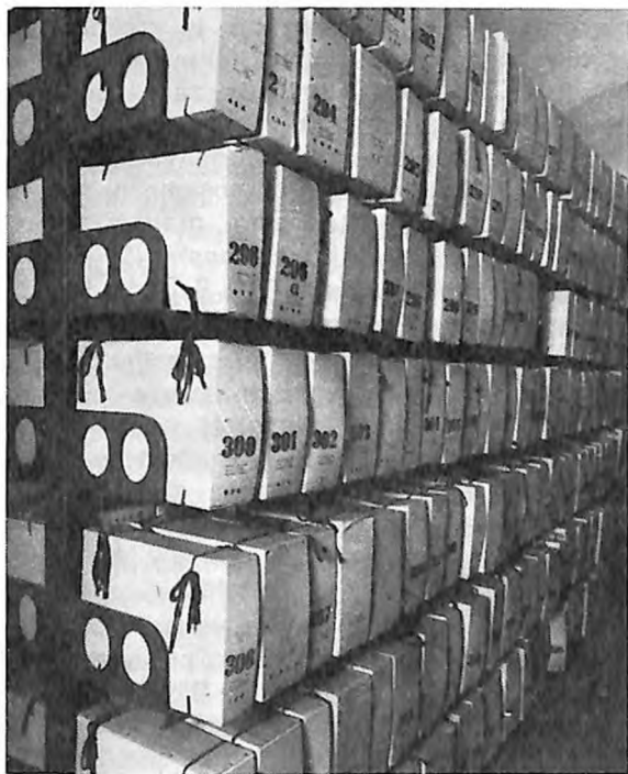
Pogled v arhivsko skladišče

Razumljivo je, da je okupatorjevega in kolaboracionističnega oziroma kontrarevolucionarnega arhivskega gra-