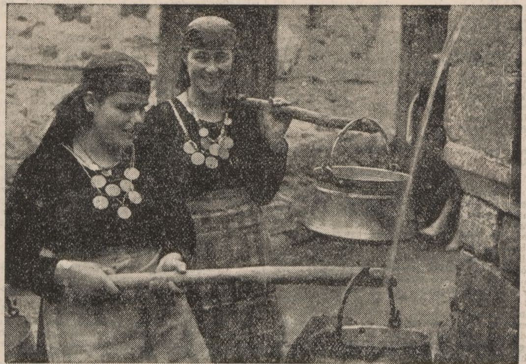
Ob vodnjaku v vasi Ustovo pod Rodopi

»Zveza protialkoholne mladine« bije trdo borbno proti najhujšim zlom človeštva, proti vojni.