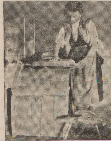
V kotu: pekovski vajencec pri svojem delu