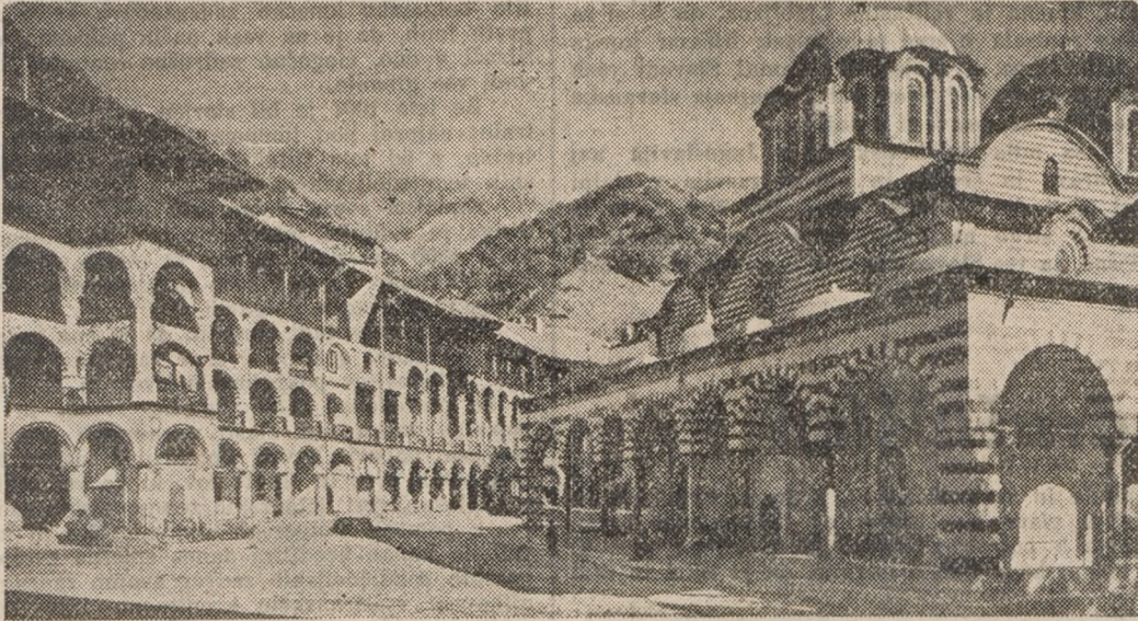
Rilski samostan pod planino Rila

Naše narodno socialno gibanje, največja in trenutno gotovo najmočnejša javna sila, ki je vzgojena v zgodovinskih tradicijah našega naroda, je kot patriotska in nacionalna sila goreč in iskren pobuditelj bratskega zedinjenja med slovanskimi narodi na polotoku in zagovornica dobrih in iskrenih stikov z vsemi sosedji. Prepojena z duhom naše miroljubnosti deluje danes z vsemi silami za ustvaritev in organizacijo države in za kulturne ter gospodarske povzdige bolgarskega naroda.