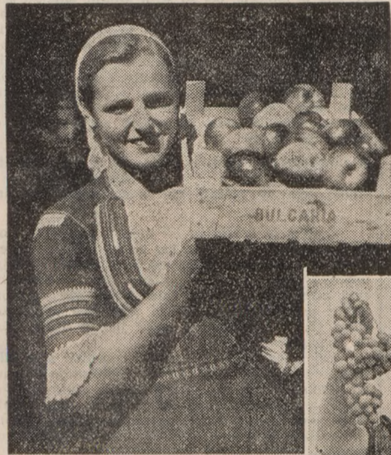
Iz okolice Kjustendila izvažajo veliko izbornega sadja