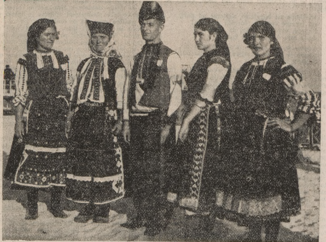
Narodna noša iz okolice Varne