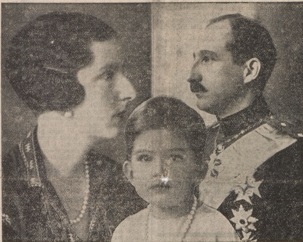
Nj. Vel. kraljica Joana, Princesa Marija Luiza, Nj. Vel. kralj Boris III.

Danes, po tolikih nesrečah, more in mora dati politično smer Bolgarije samo miroljubje in želja po dobrih odnošajih z vsemi sosedi.