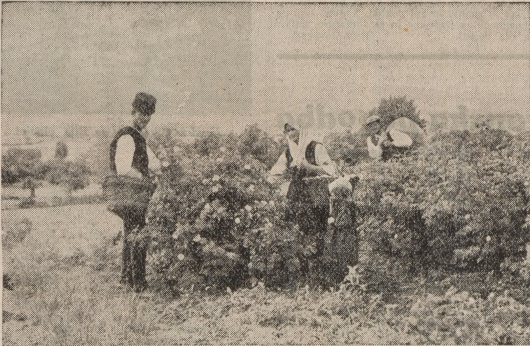
Iz Rožne doline pri Kasanliku

Naravni in gospodarski pogoji pospešujejo razvoj sviloreje, ki je važna za kmečko gospodarstvo. Posebno je razvita sviloreja v mestih in okolih: Svilengrad, Harmanli, Vraca. — Druga važna kultura je — roža, bolgarski narodni ponos. Pridelovanje rož je zelo odvisno od podnebja in zemlje. V gospodarskem oziru je pridelovanje rož za destilacijo rožnega olja zelo važna za prebivalstvo, ki živi od tega pridelka. Znamenita »rožova dolina«, ob rekah Tundže in Strume in po obron-