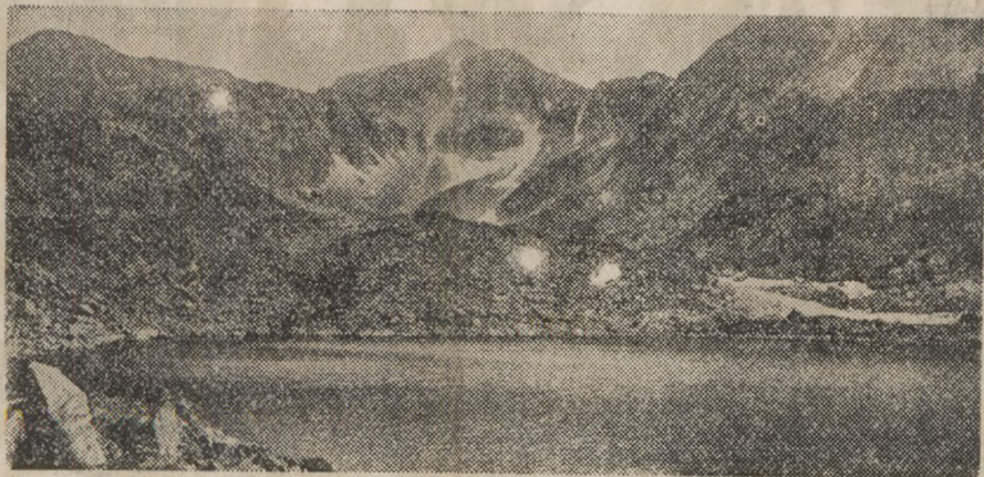
Vrh Musala (2925 m)

Na dogovor o večnem prijateljstvu med Bolgarijo in Jugoslavijo gledam jaz z več vidikov. Najprej me osebno zelo veseli, ker v tem dogovoru vidim izpolnitev tega, kar sem učil mnogo let in kar je sprejeto v naših slovanskih krogih kot vera. Drugič pa je dogovor formalni izraz tega, kar je bilo in kar bo ostalo v zavesti in želji našega naroda. Naš narod gleda na zvezo z Jugoslavijo kakor na potreben sestavni del za trajno srečo in vzajemno kulturno sodelovanje obeh držav. Končno — z visokega slovenskega vidika — se bo v tem dogovoru o večnem prijateljstvu povdarila in razjasnila formula, sprejeta pri nas in pri vseh Slovanih na vseslovanskem zborovanju, prirejenem v Sofiji leta 1910, po kateri bodo srečni vsi Slovani samo takrat, ko se bodo med seboj priskočno zblížili in ko bodo mogli roko v roki smelo iti po svoji razvojni poti do ustanovitve in okrepitve kulturne skupnosti, ki bo v svetovni kulturni zaklad mogla položiti svoj dar — za okrepitve miru, svobode in višje kulture.