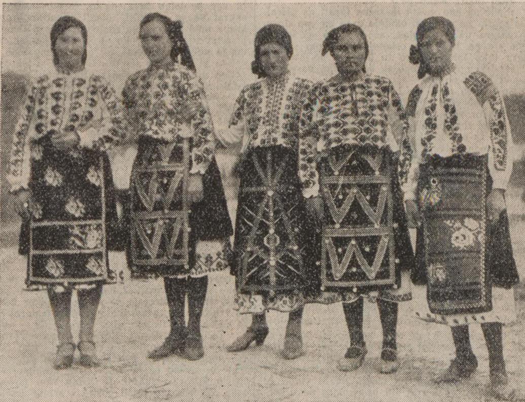
Dekliška narodna noša iz okolice Plevne