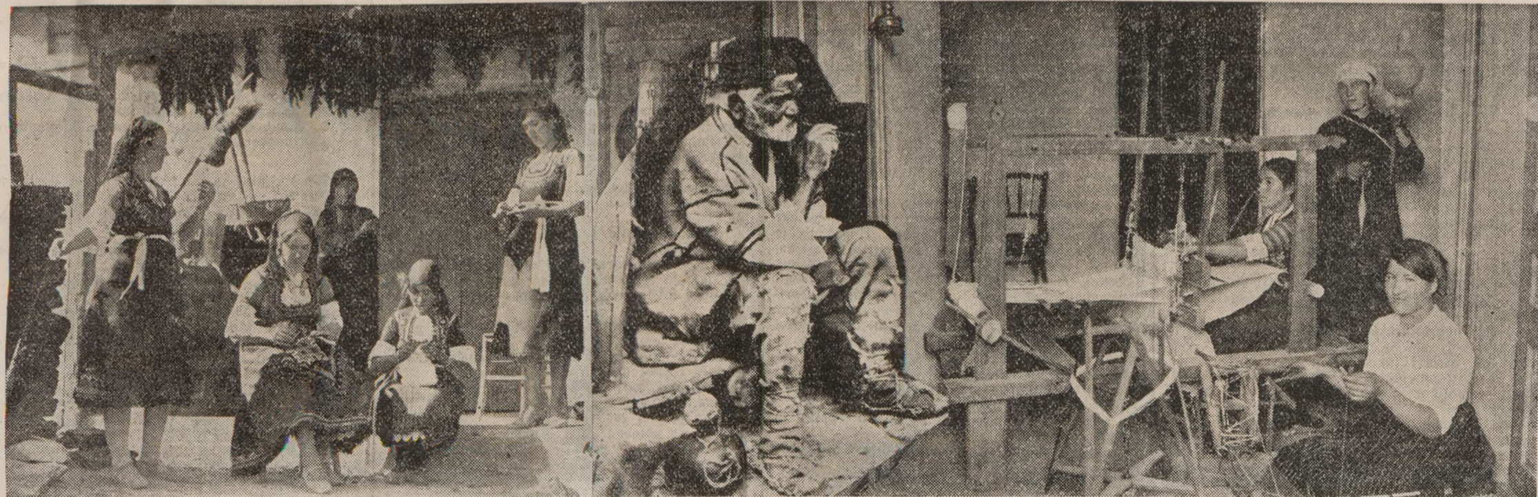
Domača ročna vretena in preproste statve v Bolgariji še niso ob veljavo. V sredi eden izmed stoletnih starčkov — taka starost v Bolgariji ni nič nonavadna.