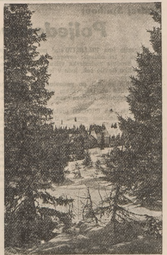
Zimska pokrajina na Rila planini