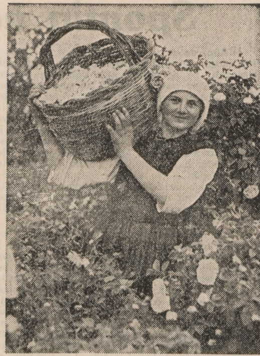
Dekle ob obiranju rož

Danes, ko imamo zopet normalne odnose z Jugoslavijo, je vprašanje postalo še bolj pereče. Današnji trenutek se nam zdi še bolj prikladen za zblizanje prav zaradi mednarodnega gospodarskega položaja. Načrti o gospodarski samozadovoljivosti narekujejo malim evropskim narodom ustanovitev večjih gospodarskih področij. Zblizanje med balkanskimi državami se more doseči najlažje z dvostranskimi gospodarskimi dogovori. Koristi, ki bi jih imela Bolgarija in Jugoslavija od dogovora o carinski zvezi, bi bile velike. Na ta način bi se ustanovila velika gospodarska enota in večji trg, katerega ne bi mogel nihče preprečiti, najmanj one države, ki uvažajo svoje proizvode v balkanske države. Taka zveza bi obema državama omogočila, da bi združeno in s skupnimi silami branili svoje pravice in da bi pri ureditvi svojih trgovskih odnosov s tujimi državami izvajali večje koristi za vnovčevanje svojih proizvodov.