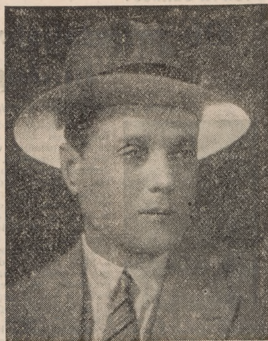
Preds. min. sveta dr. G. Kjusteivanov

Zadružništvo se je pojavilo od začetka kot kreditna gospodarska organizacija, polagoma pa preide v gospodarsko izvajenje bolgarske vasi zlasti po vojni, v zadnjih letih pa razvija že veliko gospodarsko delavnost. Iz kreditnega gospodar-