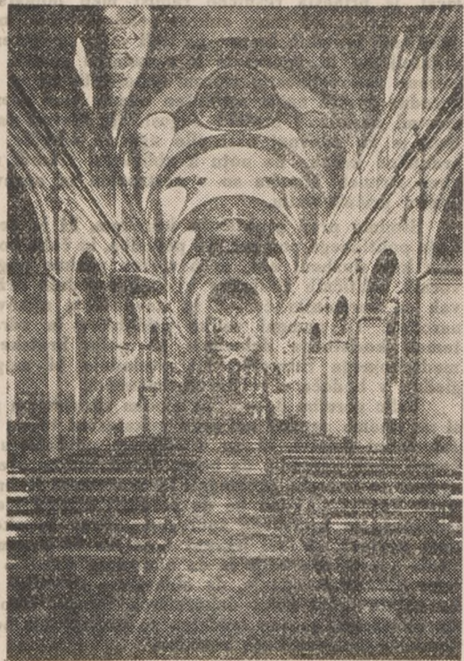
Notranjščina cerkve sv. Jožefa v Sofiji.

Sedaj skrbi bolgarski narod za gospodarski napredek države in za ohranitev najboljših odnosov s sosedi.