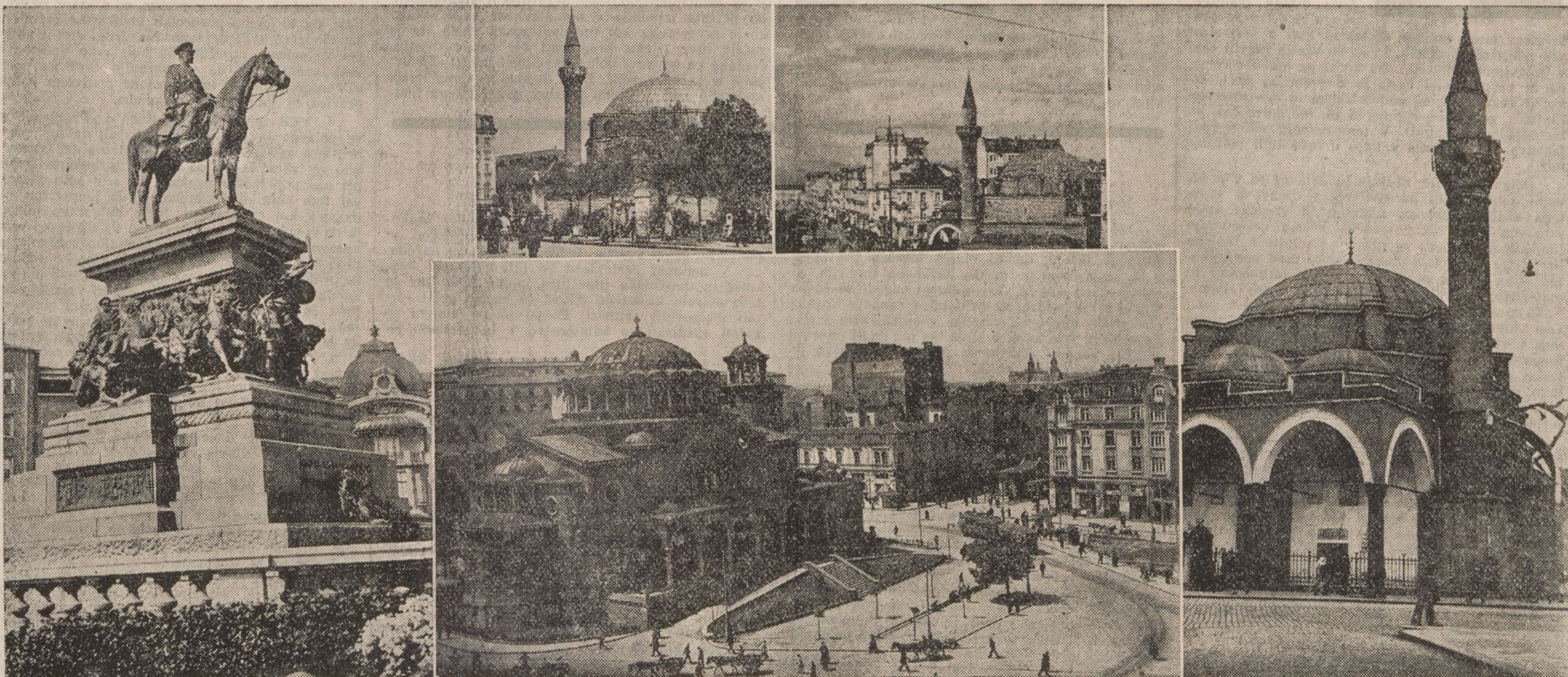
Sofija; Spomenik carja Osvoboditelja, trg Sv. Nedelje in mošeje, zadnje znamenje stoletne turške oblasti

V Sofiji je zbrana vsa kulturna in materialna moč bolgarskega naroda; ona je ne samo srce