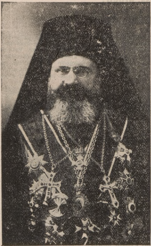
Stefan, sofijski metropolit