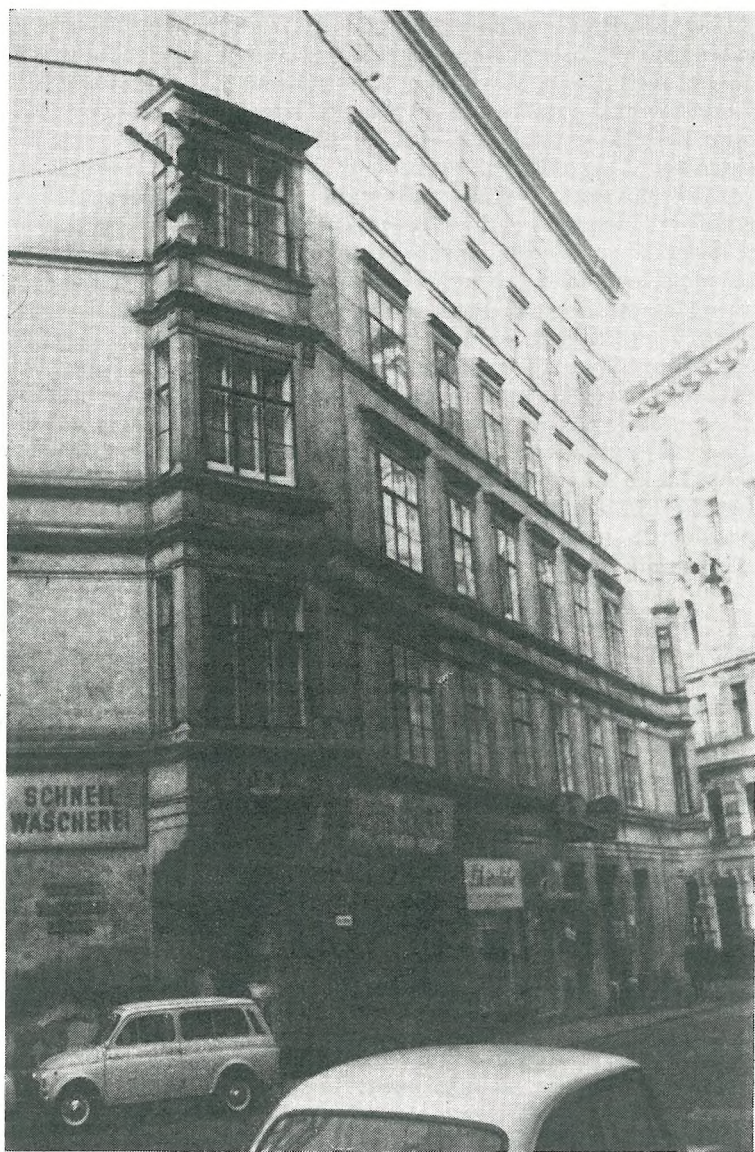
Knafljeva hiša na Dunaju