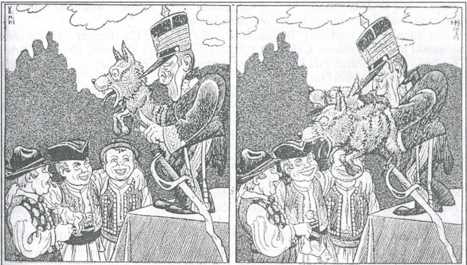
Hinko Smrekar, "Italijansko strašilo", Kurent, 1919, št. 3