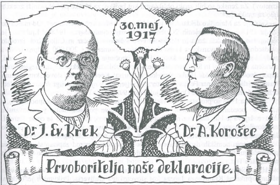
Maksim Gaspari, Deklaracijska razglednica 145