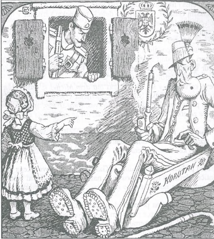
Maksim Gaspari, "Zibelka slovenstva", Kurent, 1919 št. 2