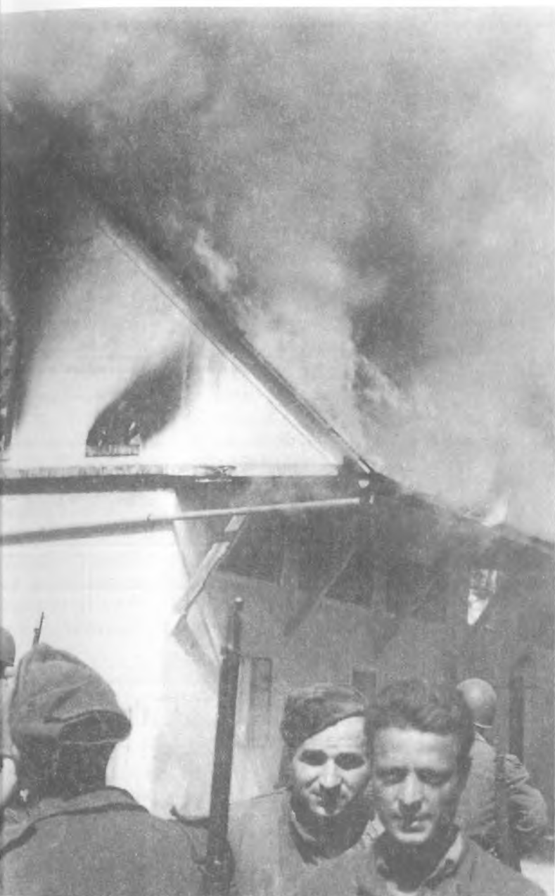
Nova vas na Blokah, požgana konec julija 1942.