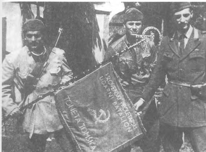
Sardinski grenadirji so konec avgusta 1942 zaplenili v bunkerju pri Pugledu na Kočevskem med drugim tudi zastavo, namenjeno 1. slovenskemu proletarskemu bataljonu Toneta Tomšiča.

ma hitro in brez posebnih zapletov usmerjati premike po prostranstvih Kočevskega roga in se izogniti neposrednim italijanskim ofenzivnim udarcem. Toda ta zamisel se je pokazala za neustrezno ob spoznanju, da se nismo umikali v varno nezasedeno roško ozemlje. Številne italijanske vojaške sile so Rog pred našim prihodom že skoraj v celoti zasedle. Kot se je kasneje pokazalo, so imeli Italijani na voljo odlične vodiče, nekdanje Kočevarje, ki so Rog poznali kot svoj žep. V Glavnem štabu so se odločili, da Rog takoj zapustimo in se iz njega za vsako ceno prebijemo. Znani poskus preboja je bil še isto noč. Preboj se ni posrečil. Naše vojaško in politično vodstvo je zato roško ofenzivo v celoti doživelo v Kočevskem rogu. Pri tem se je soočilo z vrsto tveganih in dramatičnih okoliščin.