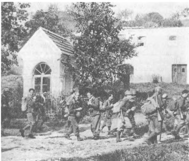
Pohod Italijanov skozi Rampoho v Kočevskem Rogu, 14. avgusta 1942.

zapustili območja, ki je pod nadzorom Italijanov in prispeli do osvojenega ozemlja. Tam se bomo ustavili, do jutra prespali in podnevi nadaljevali pot. Spanja smo bili po nemirnih in napornih tednih zelo potrebni. Hodili smo dobro uro, se ustavili in se ulegli. Vso uro smo hodili po razmeroma zaraščenem svetu in začuda ne po strmini navzgor, ampak skoraj po ravnem. Menili smo, da je to nekoliko čudno, vendar smo sklepali, da hodimo po pobočju, po katerem se verjetno le rahlo vzpenjamo in da bomo že zjutraj po počitku videli, kje točno smo in se potem po najkrajši poti povzpeli čez Malo goro na suhokrajinsko stran. Zaspali smo v prepričanju, da si končno ahko spanec v miru privoščimo. Stražil ni nihče, ker smo sodili, da glede na uro hoda od proge to ni potrebno. Kljub vsemu pa smo se, za vsak primer, zavlekli v bližnjo goščo. Ko se je pričelo daniti, smo se prebudili, vendar ne zato, ker bi bilo spanja že dovolj, ampak zaradi glasnega italijanskega govorjenja in topota njihovih nog po pragovih in gramozu železniške proge. V tisti uri hoda se namreč nismo od proge oddaljili, ampak smo, tako kot se je to tolikokrat