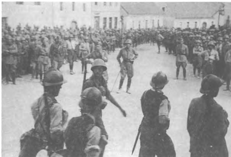
Belogardistične formacije, ko nastopajo pred italijani v Morkonogu septembra 1942.