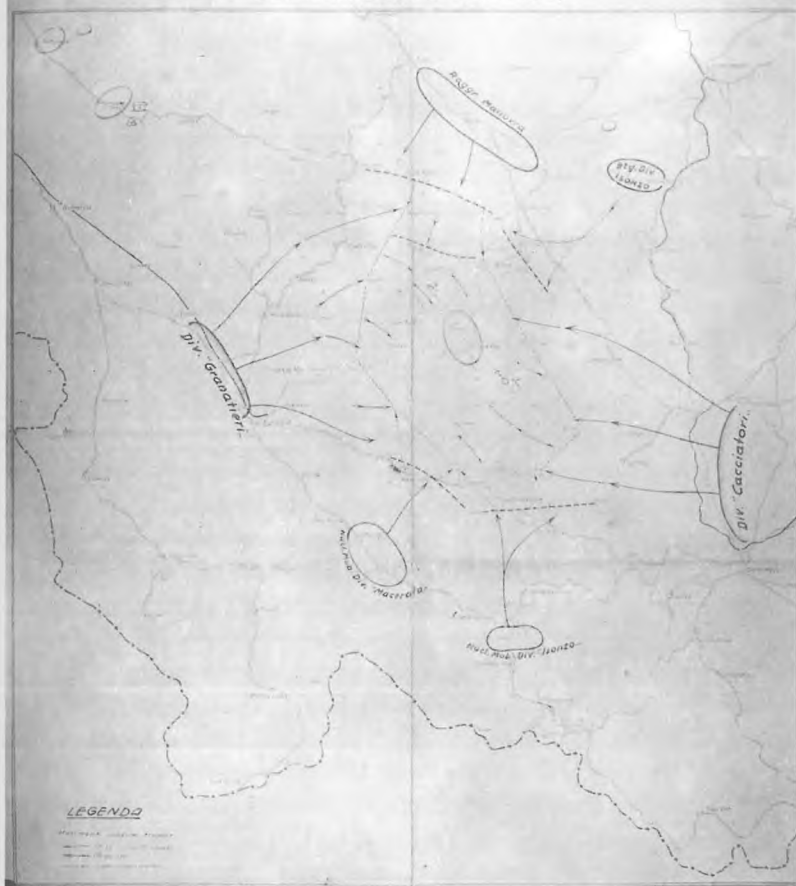
Italijanska skica napada na Kočevski Rog, avgusta 1942.

od Žužemberka prek Dvora proti Staremu Logu in Kočevju naj bi popolnoma zaprl Kočevski rog s suhokrajinske strani.