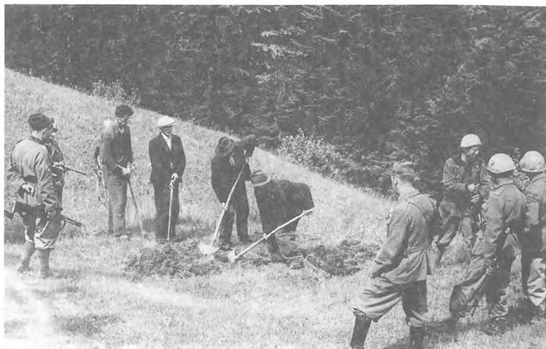
22. julija 1942 so Italijani ustrelili 4 domačine iz Zavrha nad Cerknico. Pred ustrelitvijo so si morali sami izkopati grob.

mo na ta način razlagam, da smo vsaj navidez kljubovali žeji. Lakote z žejo ni bilo mogoče primerjati. Prva dva dni sem lakoto občutil, kasneje pa za želodec sploh nisem vedel. Rasla pa je zaspanost. Ko sem kasneje mislil na te dni, se je v meni utrdilo prepričanje, da bi najbrž nadaljnje gladovanje sploh ne bilo mučno: Če pa bi trajalo v nedogled, bi se zazibal v sen.