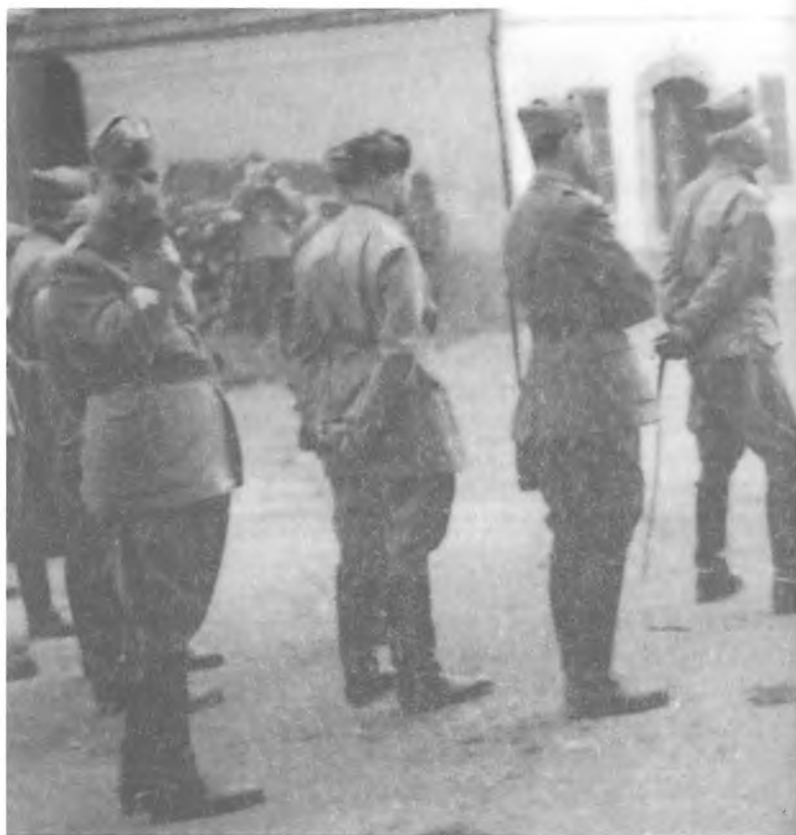
General Mario Robotti s spremstvom v Mokronogu, 15. septembra 1942.

in ga za vsako ceno najti. Glasno je tudi razmišljal o vzrokih, zakaj ga trenutno ni v koloni. Celoten Kidričev odziv se je zlival v en sam refren: »Najhujše se s Kardeljem ni moglo zgoditi, ni padel, moramo ga najti, on živi in drugače ne sme biti!«