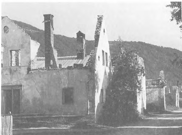
V ofenzivi so Italijani požgali mnogo vasi: Vrhnika v Loški dolini, julija 1942.

uporabi. Naše maloštevilne enote so zelo uspešno več dni kljubovale veliki italijanski premoči. Bojevale so se zelo preudarno. Nenehoma so prehajale v drzne protinapade in s takim odporom presenetile Italijane takrat, ko so to najmanj pričakovali, saj so računali, da so partizani na tem območju že dokončno razbiti. Potek spopada s borcem, ki so v njem sodelovali, vračal vero v možnost trajnejše obrambe osvobojenega ozemlja. Odpor pri Sodražici je bil zlomljen, ko so poslali Italijani zelo močne sile partizanom v hrbet. Umor je bil nujen, obroč Italijanov okoli prej imenovane svobodne oaze pa dokončno sklenjen.