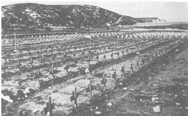
Ti so za vedno ostali na Rabu.

bil naslednji: del odreda se je moral premakniti čez progo Ljubljana-Trst na Ljubljanski vrh in po potrebi globlje na Notranjsko, drugi del pa je moral prestopiti t. i. mejo med Ljubljansko pokrajino in Gorenjsko. Na Gorenjskem je moral ostati ves čas dolomitske ofenzive. Ta meja se je formalno imenovala nemško-italijanska državna meja in je bila zavarovana po vsej dolžini z razmeroma širokim minkim poljem in močnimi nemškimi obmejnimi enotami. Ko smo ugotovili, da se bo ofenziva v Dolomitih čez dober dan začela, smo načrt izvedli. Del odreda se je premaknil na Ljubljanski vrh. Drugi del, ki je odšel na Gorenjsko, je premik izvršil zadnji trenutek, v času, ko so Italijani že obkoljevali dolomitsko področje. Štab odreda je sklenil, da gre z enotami, ki so se premaknile na Gorenjsko, in sicer zato, ker so te več tvegale. Odšle so v okolje, ki so ga Nemci v glavnem temeljito obvladali. Če bi prišlo do spopada z Nemci, bi se ta del odreda mnogo težje branil kot tisti, ki se je umaknil na Notranjsko. V primeru večjih izgub bi bil zato štab odreda zanje neposredno odgovoren. Z odrednim štabom sem šel tudi jaz. Prehod čez mejo je bil temeljito pripravljen. Prešli smo jo brez zapletov. Ker nas Nemci niso opazili, smo imeli možnost, da ostanemo neodkriti in se tudi neopazno vrnemo. Imeli smo dobre poznavalce terena in povezavo z nekaterimi gorenjskimi enotami. Zato nam je uspelo nedaleč od meje v Poljanski dolini na težko dostopnem strmem pobočju najti kraj, kjer