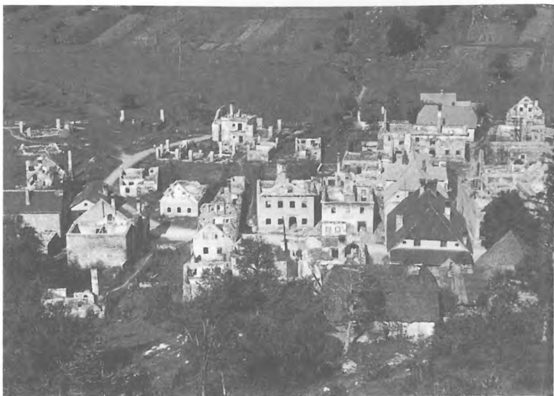
Lož, požgan 1. avgusta 1942.

niso več sistematično prečesavali. Njihovi osnovni položaji, to je vse zapore in obroči, so še ostali.