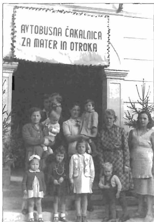
Avtobusna čakalnica za matere in otroke v Idriji, 1949.