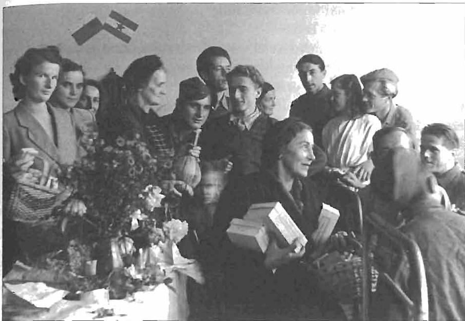
Članice AFŽ obdarujejo vojaške invalide v Ljubljani.