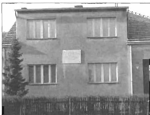
Hiša na Dubravi pri Zagrebu, kjer je bila oktobra 1940 5. državna konferenca KPJ.