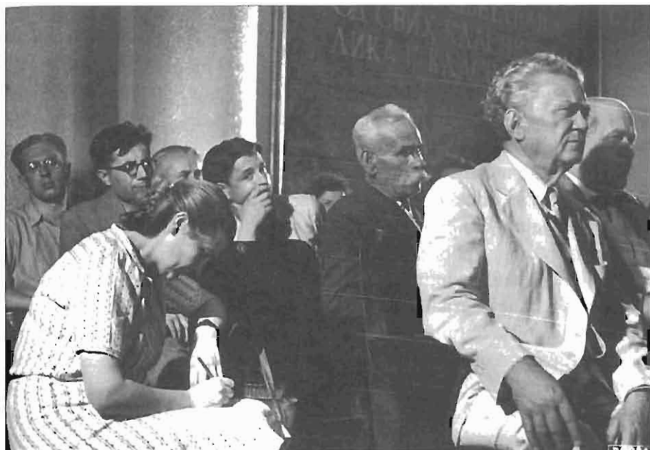
Vida Tomšič na 5. kongresu KP Jugoslavije, 1948.