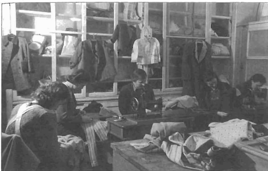
Krpalnica in šivalnica AFŽ Ljubljana.