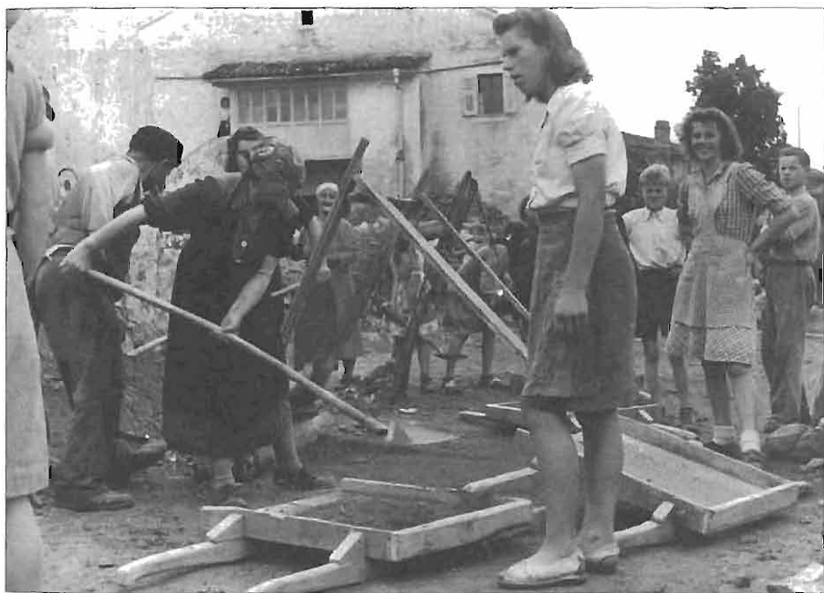
Mladinke in članice AFŽ tekmujejo za čim hitrejšo zgraditev domov. AS 1202/303, fototeka Naša žena.