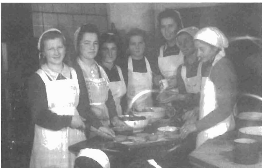
Kuharski tečaj v Stranjah (v okolici Kamnika). AS 1202/233, fototeka Naša žena.