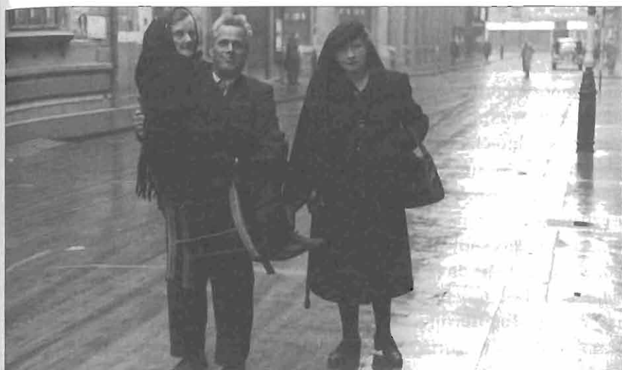
Mati Ljubljančanke, ki je izgubila moža v narodnoosvobodilnem boju, se je udeležila volitev kljub starosti in bolezni, pa čeprav jo je bilo treba na stolu odnesti na volišče. Ljubljana, 11. 11. 1945.