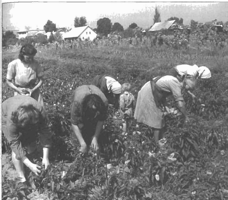
Vrtna skupina zadružnic v Arji vasi pri pobiranju paprik.