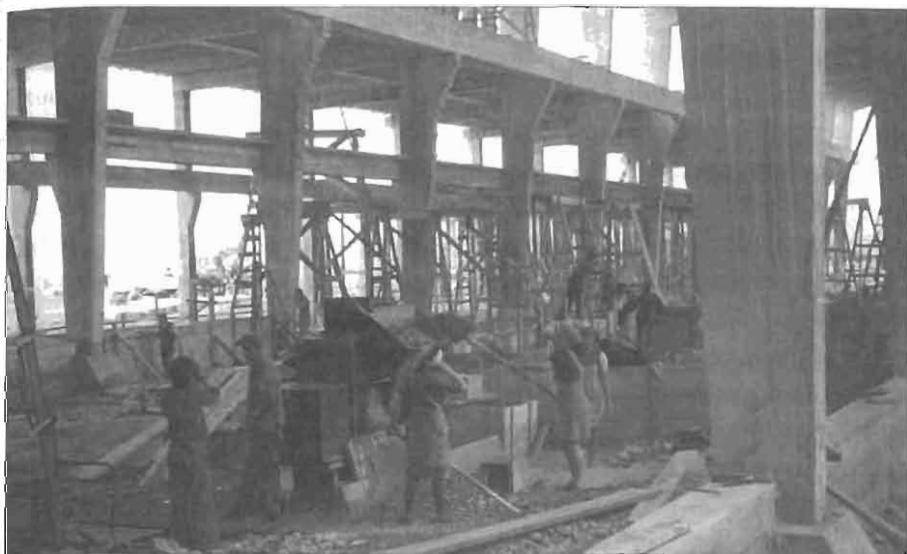
Pri gradnji Litostroja so bile zaposlene tudi ženske, 5. 5. 1947.