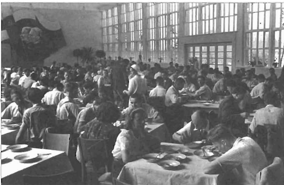
Delavke in delavci tovarne Litostrój pri kosilu v novi menzi.