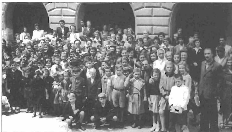
Skupina bosanskih otrok z rejniki in članicami AFŽ pred odhodom iz Maribora, 18. 6. 1946.