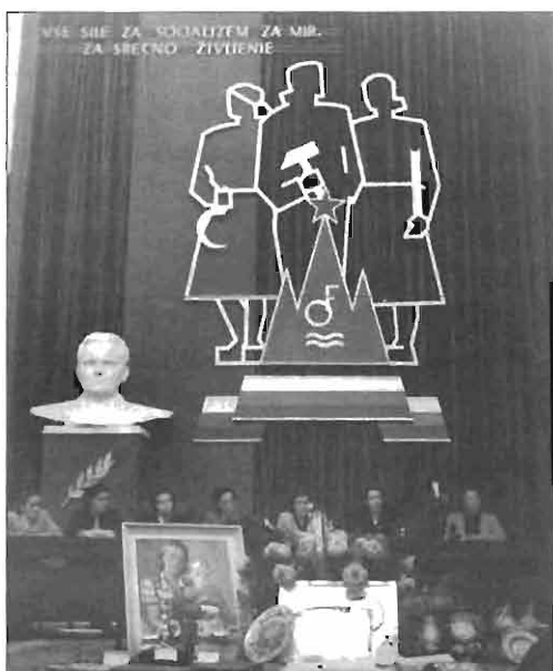
Zadnji kongres AFŽ Slovenije, novembra 1952 v Ljubljani. AS 1202/304, fototeka Naša žena.