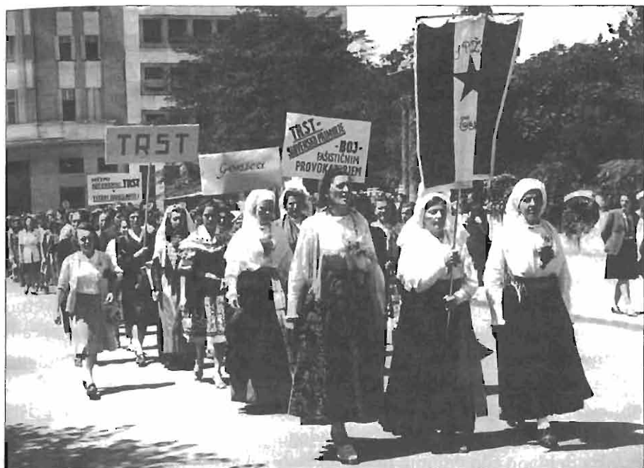
Slovenska delegacija na kongresu AFŽ Jugoslavije v Beogradu, julij 1948. AS 1202/299, fototeka Naša žena.