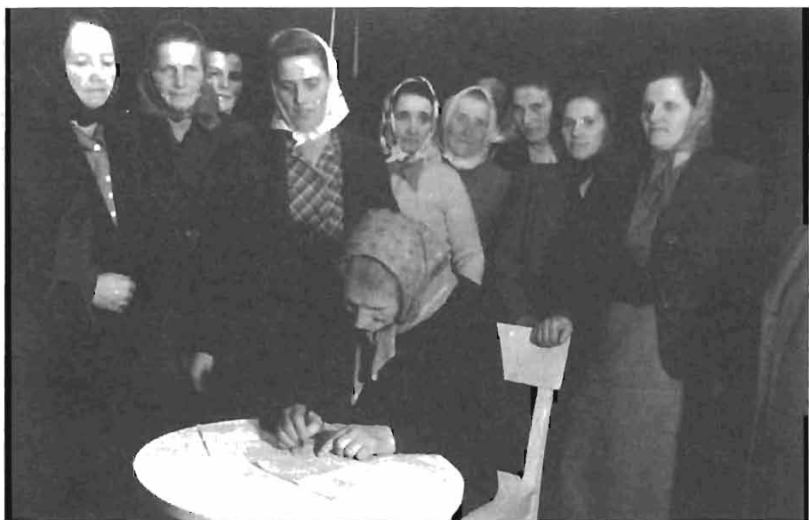
Podpisna akcija za mir, Kresnice, 7. november 1948. AS 1202/306, fototeka Naša žena.