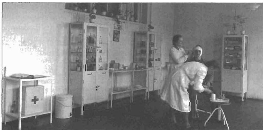
Žensko zdravstveno osebje v tovarni avtomobilov v Mariboru.