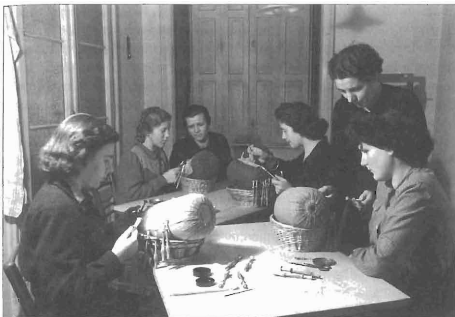
Državna strokovna šola za žensko domačo obrt v Ljubljani, 7. 1. 1948.