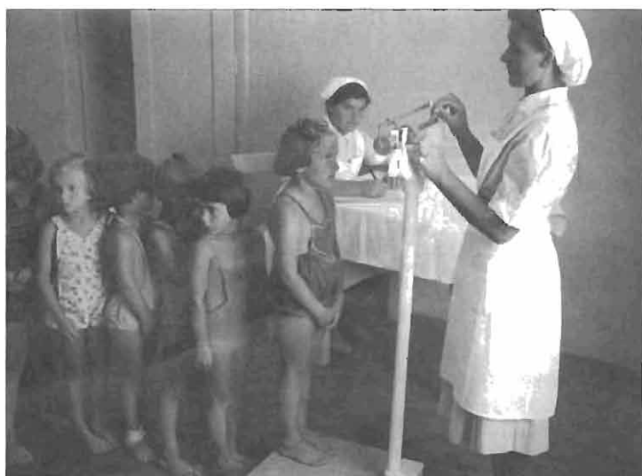
Šolski zdravniški pregled.