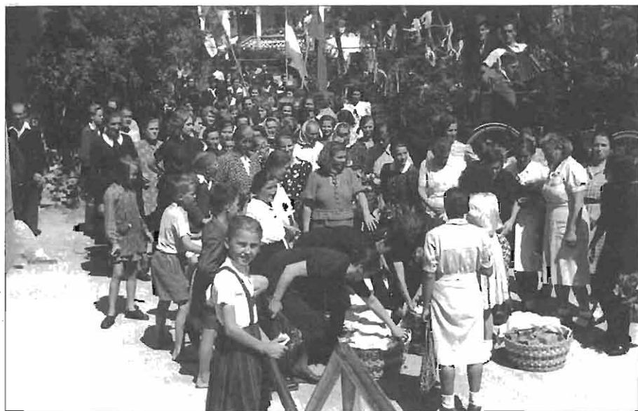
Mladinke in članice AFŽ iz Kokrice pri Kranju so prišle v Preddvor s košarami hrane za revne otroke. AS 1202/303, fototeka Naša žena.