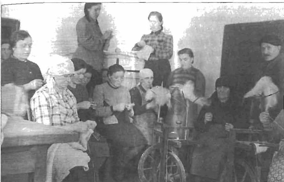
Članice AFŽ iz vasi Trava pletejo in predejo za partizane, 1944.