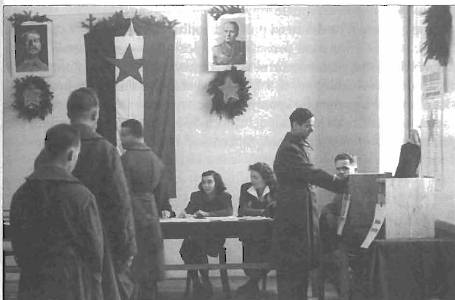
V volilni komisiji so bile tudi ženske. Volišče na srednji tehnični šoli na Mirju v Ljubljani, 11. 11. 1945.