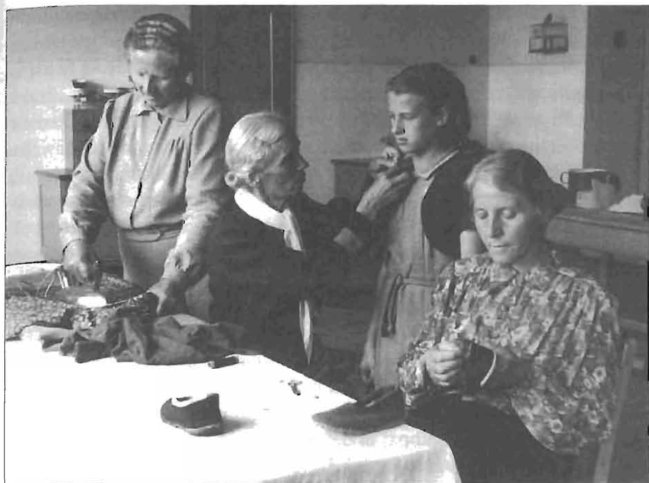
Ljubljanske žene šivajo v domu igre in dela. 1202/205, fototeka Naša žena.