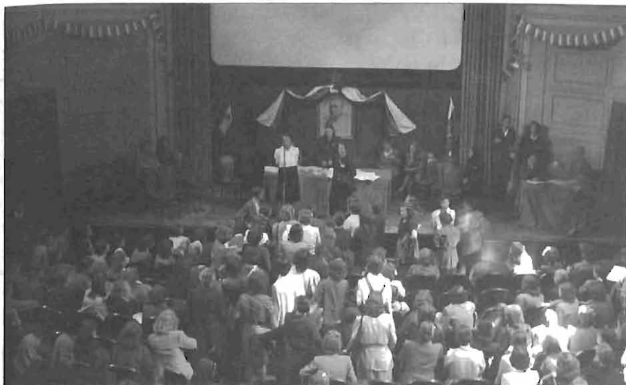
Kongres AFŽ Slovenije v Ljubljani, junij 1945. AS 1202/301, fototeka Naša žena.